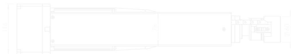
Einbautiefe mounting depth