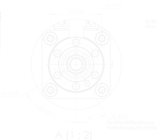
A (1 : 2)